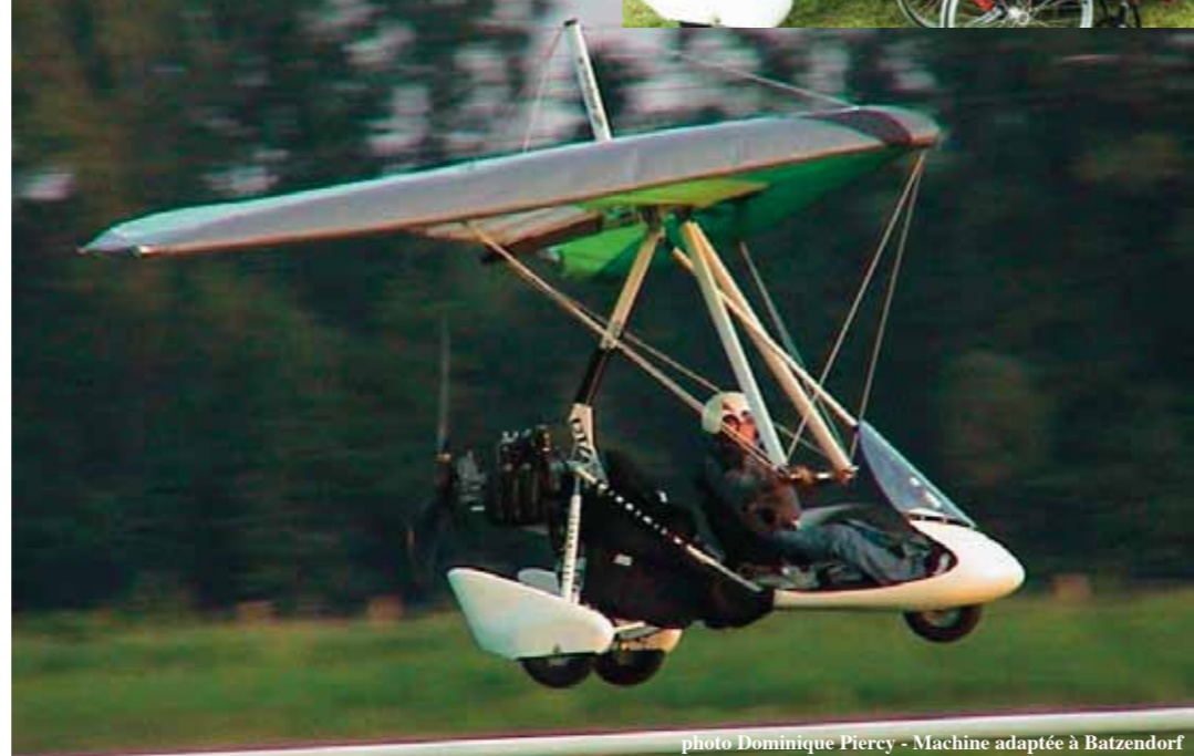
Machine adaptée à Batzendorf