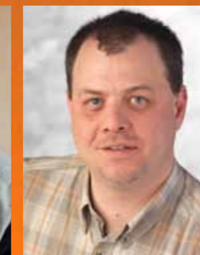
Raphael Ludwig Reportages clubs / communication plateformes